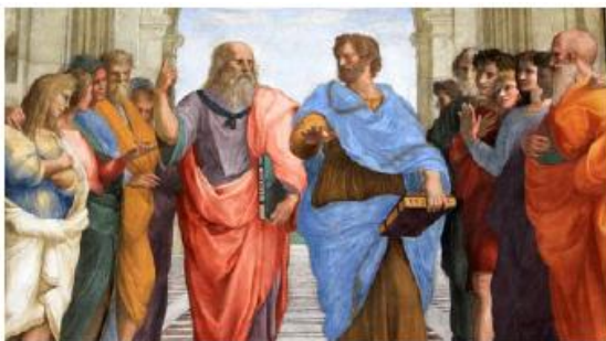
Platons un Aristotelis staigājot un debatējot. Detaja no Rafaēla "Atēnu skolas" (1509-1511)